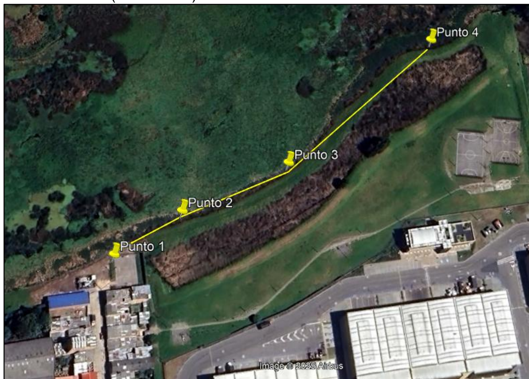
Ilustración 1. Recorrido

Con base en lo anterior, el día 02 de mayo de 2025 se realizó recorrido de control y vigilancia en el humedal Gualí desde las coordenadas 4°42'10,716" N-74°11'37,77" W hasta las coordenadas 4°42'16,302"N-74°11'31,344"W (ver ilustración 1. Ruta amarilla) barrio Francisco Martínez Rico, ecosistema que fue declarado por la Corporación Autónoma Regional de Cundinamarca - CAR como Distrito Regional de Manejo Integrado a través el acuerdo 001 de 2014 "Por medio del cual se declaran como Distrito Regional de Manejo Integrado (DMI), los terrenos comprendidos por los humedales de Gualí, Tres Esquinas y Lagunas de Funzhé, y su área de influencia directa ubicada en los municipios de Funza, Mosquera y Tenjo, Cundinamarca", y estableció tres zonas: 1. Preservación (espejo de agua), 2. Recuperación (50 metros) y 3. Uso sostenible (100 metros).